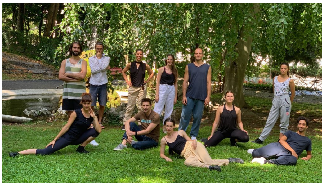
Arearea – Noi siamo il tricheco

In occasione di UdinEstate 2020 del Comune di Udine, l'ERT conferma la propria natura multidisciplinare consacrando un'intera giornata alla danza assieme alla Compagnia Arearea, l'unica realtà coreutica regionale riconosciuta dal Ministero. Sabato 25 luglio a partire dalle 10, i Giardini Ricasoli ospiteranno ben 7 repliche (distribuite dalle ore 10 alle 20) di Noi siamo il Tricheco . Ispirata al John Lennon più lisergico, la performance è la prima di un trittico dedicato dalla compagnia udinese alla musica della contestazione.