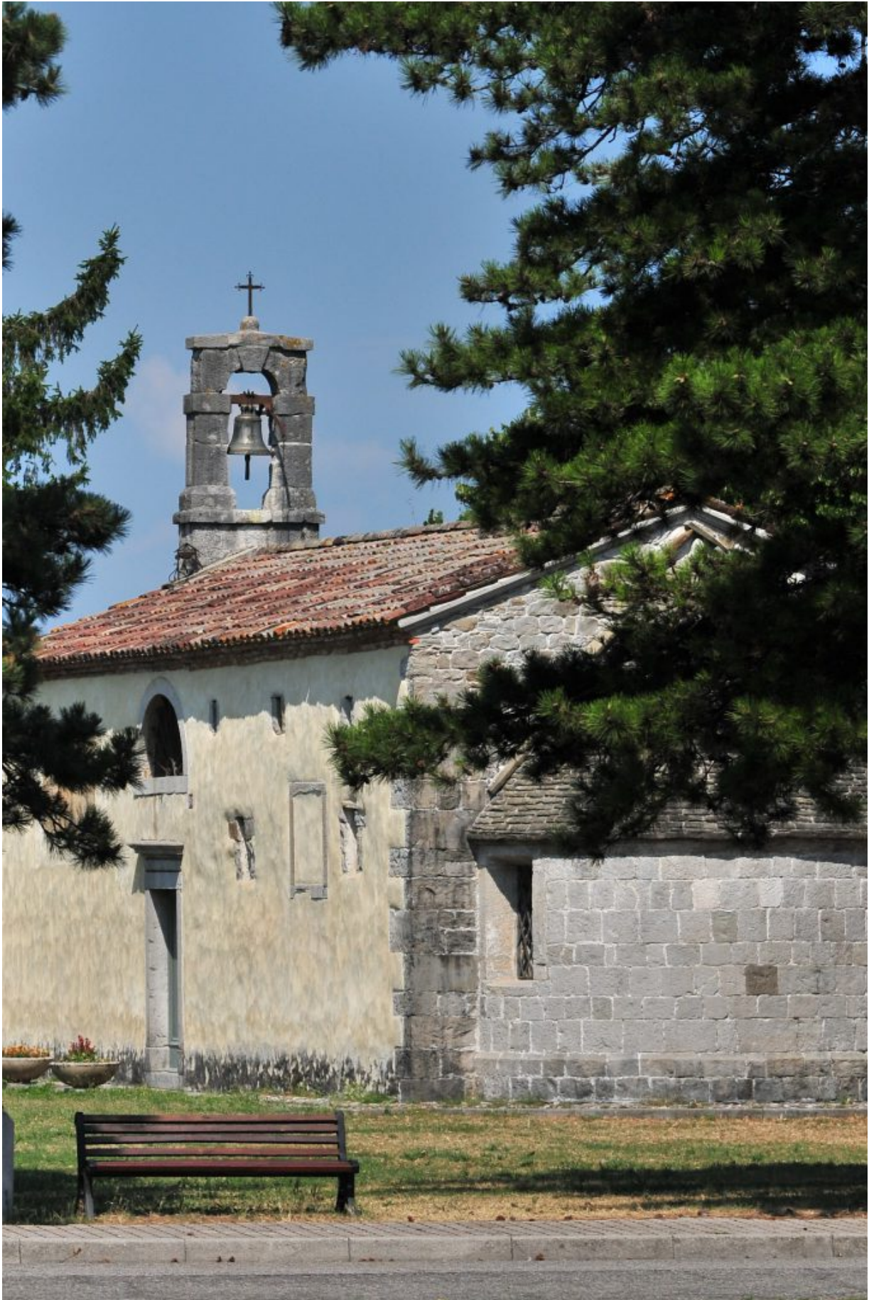
La chiesa di San Giovanni in Malina