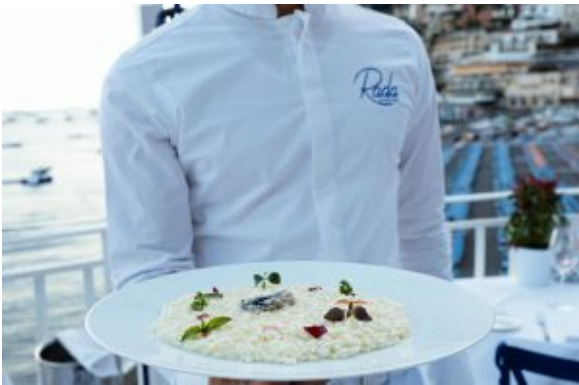
Risotto Carnaroli, limone, ostrica e prosecco_Rada Positano_ph. Claudia Izzo

Lo spettacolo pirotecnico di Ferragosto che si svolge a Positano è uno dei più belli e suggestivi d'Italia in quanto si tiene in uno dei luoghi più magici e romantici al mondo. Il centro del Paese si anima con canti e danze popolari, e a mezzanotte tutto si ferma per ammirare i tradizionali "fuochi a mare" .