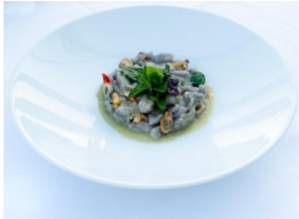
Gnocchetti di patate viola con frutti di mare, zucchine e pomodorino giallo