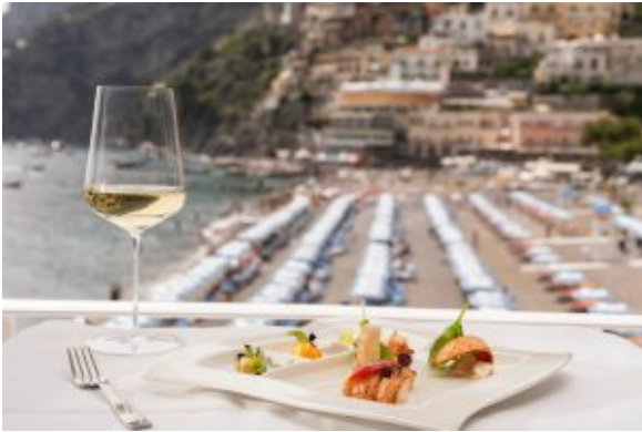
Astice alla griglia