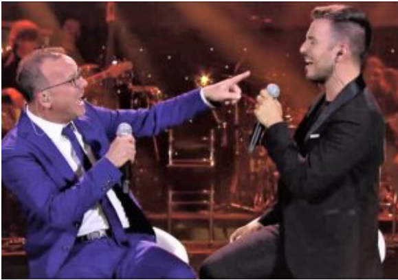
Andrea Sannino e Gigi d'Alessio