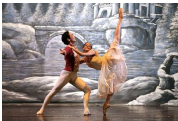
Lo Schiaccianoci – Compagnia Nazionale coreografia di Luigi Martelletta – Teatro Italia 14 nov 2014

favore di una formula spettacolare che esaltasse maggiormente lo spirito favolistico. Anche la drammaturgia è profondamente innovativa nella scelta dei temi. Ogni personaggio, infatti, è tratteggiato secondo scansioni psicologiche di forte impatto teatrale. Lo spettacolo, comunque, ripercorrerà quell'itinerario danzato che molti conoscono e si aspettano e non mancheranno le danze più note di questo capolavoro di Čajkovskij, dalla danza russa, cinese, araba, spagnola al famoso valzer dei fiori o ai fiocchi di neve, mantenendo così la struttura e la regia che il grande coreografo Marius Petipa già a fine Ottocento aveva previsto.