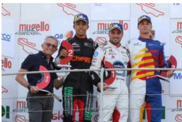
Podio dei vincitori

Alla Porsche Carrera Cup Italia 2019, il celebre campionato monomarca, partecipa qualcuno che ormai è di casa. Si tratta del team Ghinzani Arco Motorsport – Centri Porsche di Milano, capitanato dall'imprenditore Giacomo Scanzi, che prosegue l'avventura avviata dal celebre fondatore ed ex pilota Piercarlo Ghinzani. Basta dare un'occhiata al palmarès del gruppo per apprezzare la portata di 19 anni di storia: 37 pole position, 54 vittorie, 146 podi. Quest'anno il team ha messo in gara tre vetture, delle 911 GT3 Cup di seconda generazione capaci di affrontare i circuiti più famosi della nostra penisola, come Monza, Misano, Imola, Mugello, Vallelunga.