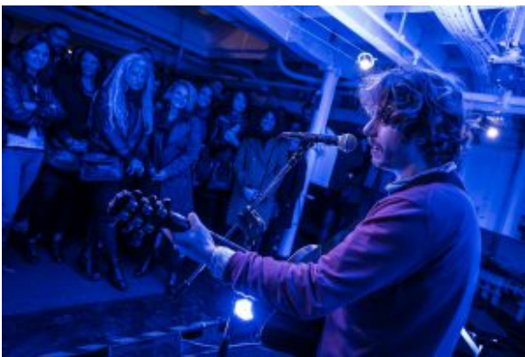
Secret Concert Barcolana 2017

Dopo il successo delle ultime due edizioni che hanno visto l'esibizione di Mauro Ermanno Giovanardi in un'ex rifugio anti aereo della seconda guerra mondiale (Kleine Berlin in via Fabio Severo) e di Lodo Guenzi de Lo Stato Social nella sala motori dell'Ursus, viene riproposto a Trieste il curioso evento conosciuto in tutta Europa con il nome di Secret Concert che si terrà domani sera, venerdì 12 ottobre , come appuntamento speciale del programma di Barcolana 50 , la 50esima edizione della regata velica più affollata del mondo.